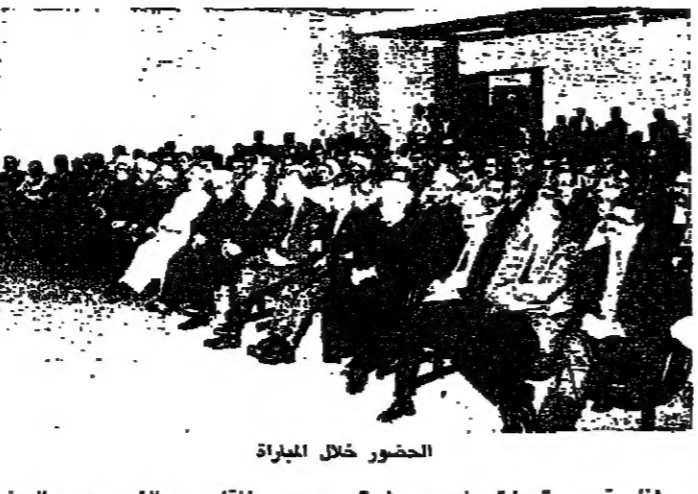
الحضور خلال المباراة

للمناسبة مرور مئة وحدى عشرة سنة على تأسيسها، أقامت جمعية المقصد الخيرية الإسلامية في قاعة الدكتور مصطفى خدي بي محمد التبريز العالي الوطني، الاحتفال الذي يبارك تلاوة القرآن الكريم في مساجد بيروت وحضره الرئيس شفيق الوزان، ممثل سلطة مفتي الجمهورية وأمين علم دار الأفتاء الدكتور محمد رشيد قباني، رئيس الجمعية السيد كامل الدكتور جميل كبي نائب رئيس الجمعية وعدد من الشخصيات. ويعد كلمة الترحيب التي ألقاها الشيخ زكريا غنصور مشوهاً